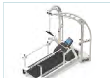
Portique de Délestage Airwalk AP, Barres latérales ajustables en hauteur et écartement