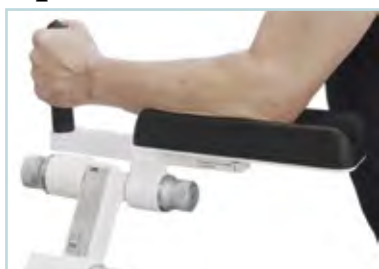
Supports Avant-Bras ajustables en hauteur et largeur