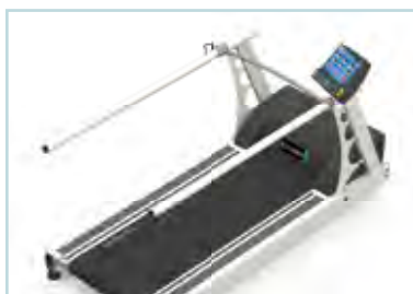
Barres latérales longues