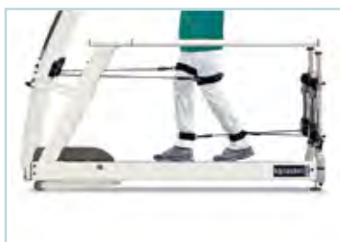
Robowalk® Expander système