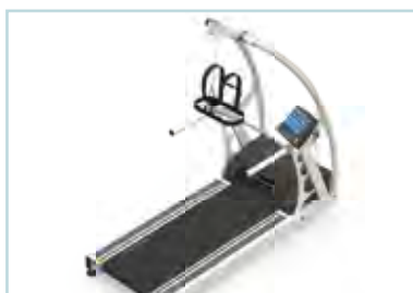
Arceau de sécurité + arrêt de sécurité