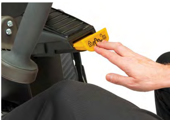
La fonction StrideLock® verrouille poignées et pédales.