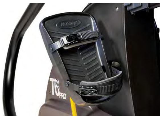
Sangles de pied réglables