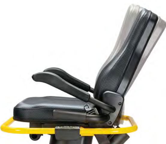
Inclinaison du dossier à 12 degrés